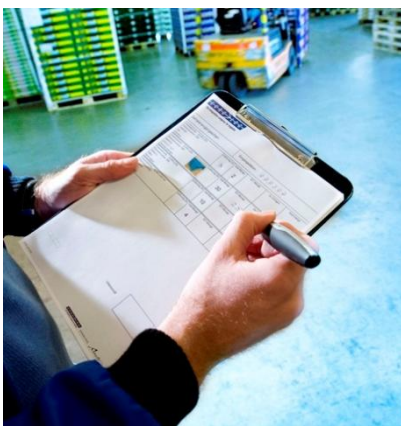
Warenannahme mit der Digital-Stift Lösung von EURO-LOG

Logistikdienstleister setzen die Digital-Stift Lösung von EURO-LOG bereits sehr erfolgreich für die Generierung von Ablieferbelegen ein. Dies gilt insbesondere auch als Ergänzung zu vorhandenen Scanner-Systemen bei temporären Einsätzen von Fuhrunternehmern, KEP- und Kurier-Dienstleistern oder im Ladungsverkehr.